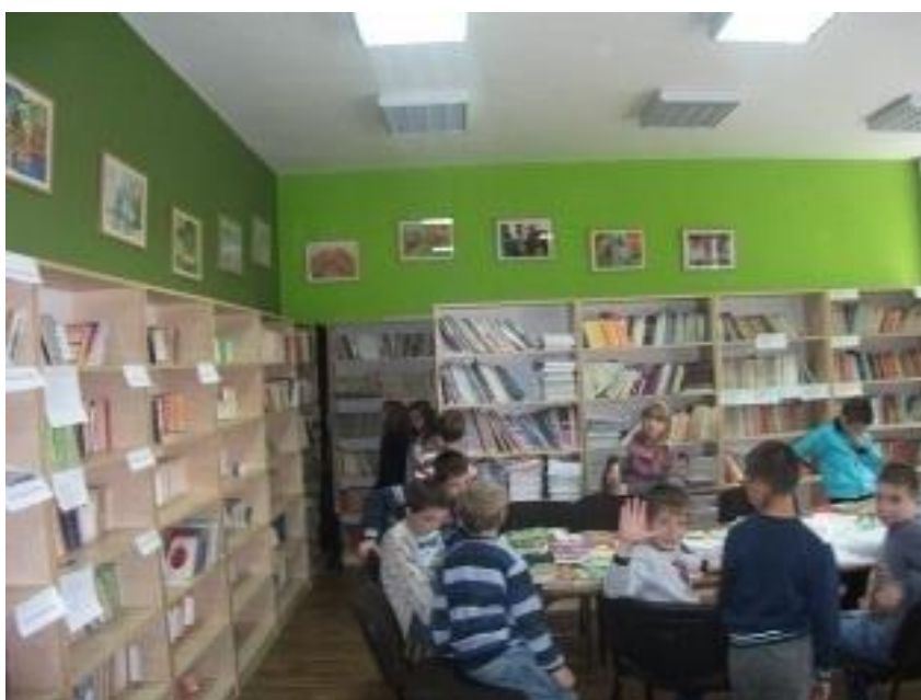
Слика 6: Школска библиотека

У оквиру школе ради ученичка библиотека која располаже са 10.049 књига, од којих је 600 набављено у прошлој школској години, а у стручној библиотеци је 1.500 књига. Читаоница располаже са 20 места за ученике.