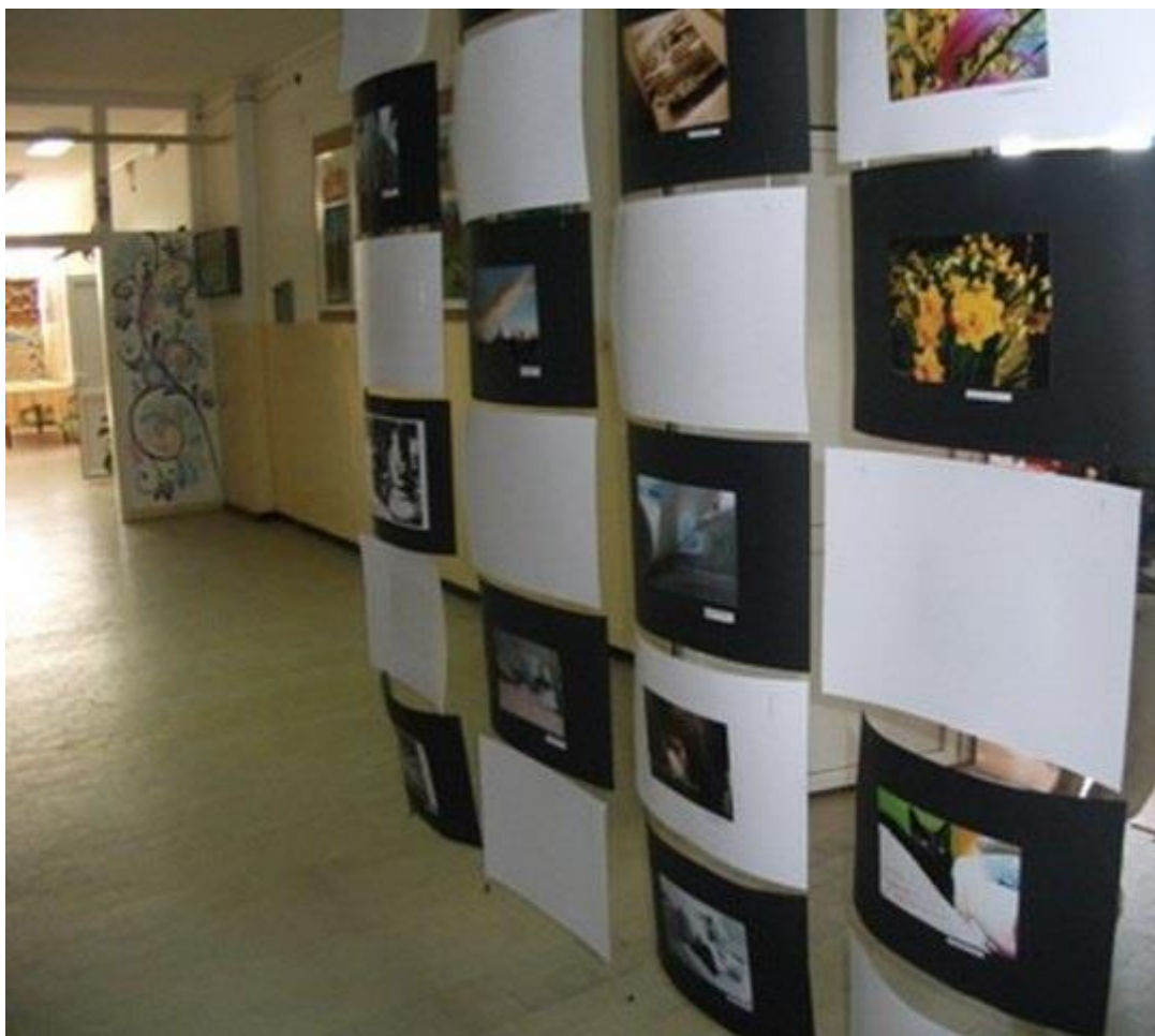
Слика 2. Садашњи ентеријер школе

На темељима традиције, остварених резултата и успеха ученика и наставника који су радили са њима школа гради савремену оријентацију, руководећи се принципима модернизације наставе, подстицања личног развоја ученика, наставника, родитеља и њиховог активног учешћа у раду школе. Школа тежи да однегује амбијент у коме ће се ученици правилно развијати, добро осећати и квалитетно учити.