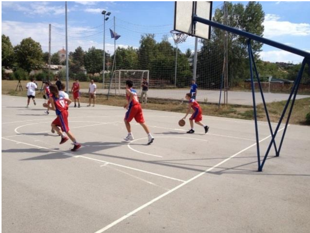
Слика 5: Час физичкој на спортиским теренима