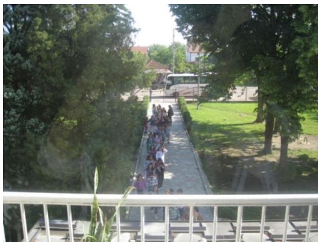
Слика 4: Посејта предшколаца